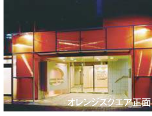
オレンジスクエア 正面