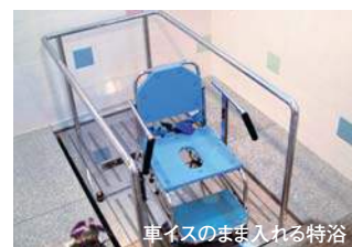
車イスのまま入れる特浴